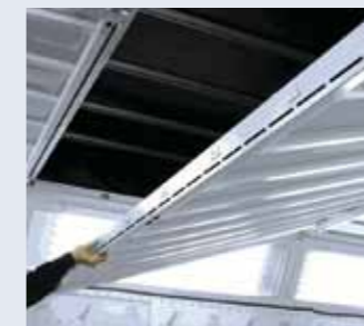
Possible opening and ceiling filters replacement. Posibilidad de apertura y sustitución del filtro de techo.