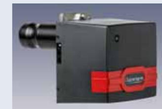
Oil or gas burner. Quemador de gasoleo/gas.