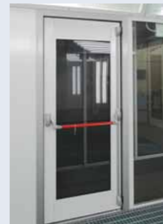
A side personnel door with internal panic bar. Puerta peatonal con cierre antipánico interno.