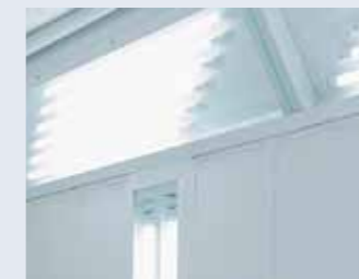
LED tubes. Tubos LED.