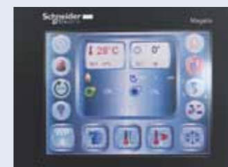
Touch screen control panel with PLC. Panel de control con pantalla digital PLC.