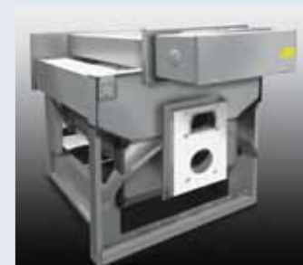
Corrosion safe heat exchanger supplying 4 flue ways. Intercambiador de calor en acero anticorrosivo diseñado para un alto rendimiento térmico.