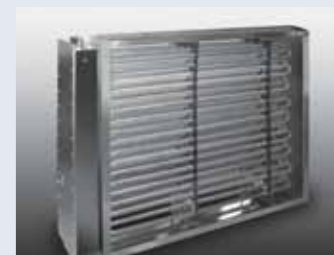
Electric resistance heater. Calentador por resistencia eléctrica.