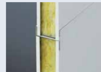
Wall panels joined by H channels. Detail of the glass-wool insulation. Unión de paneles con perfiles en H. Detalle con aislante de fibra de vidrio.