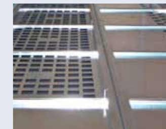
Paint-stop filter trays for air evenness in the booth box. Bandejas selectoras del flujo de aire en el basamento.