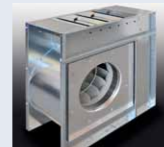
Direct drive centrifugal fans. Ventiladores de eje directo acoplados a los motores.