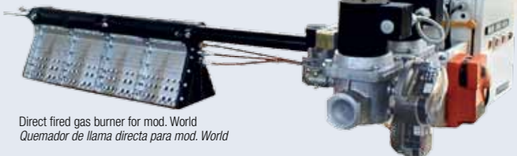
Direct fired gas burner for mod. World Quemador de llama directa para mod. World