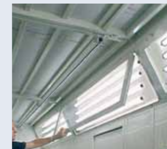
Hinged light fixtures for ease of cleaning and maintenance. Plafoneras en ángulo con bisagras para la limpieza y la manutención.